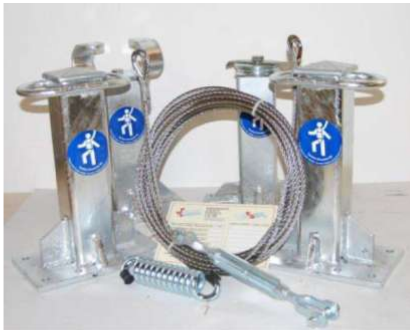
GANCIO X 1 PERSONA